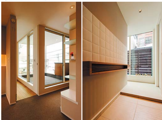
上 / 明るい暖色系の塗り壁と、こげ茶のガルバリウムを組み合わせた外観。北に面するこちら側には窓は少なく、開口部は玄関とその上のテラスが中心 下左 / 2階のバルコニーを囲むようにフリースペースが広がる。右手には飾り棚を設置 下右 / 玄関を入ると左手の壁にはページのエコカラット

関東在住のIさんが、次に暮らす場所として新潟を選んだ。スノーボードが大好きで、頻繁に通っているうちに「住んでみたい」と思ったのだという。「スキー場へのアクセスが良く、生活も便利なところ」と絞ったエリアが長岡。続けて「地元のことをよく知っている地元ビルダーに建ててもらいたい」と検索、まず目に留まったのがディテールホームだった。新潟、三条、長岡と県内3ヶ所に事業所を持つ同社の本拠地は長岡で、Iさんにとって「土地探しも含めてお願いできるかもれない」という期待もあったが、一番の決め手はデザイン性だった。「離れて家づくりをすることもあって、お任せにしても大丈夫と思えるデザイン力が不可欠でした」とIさ