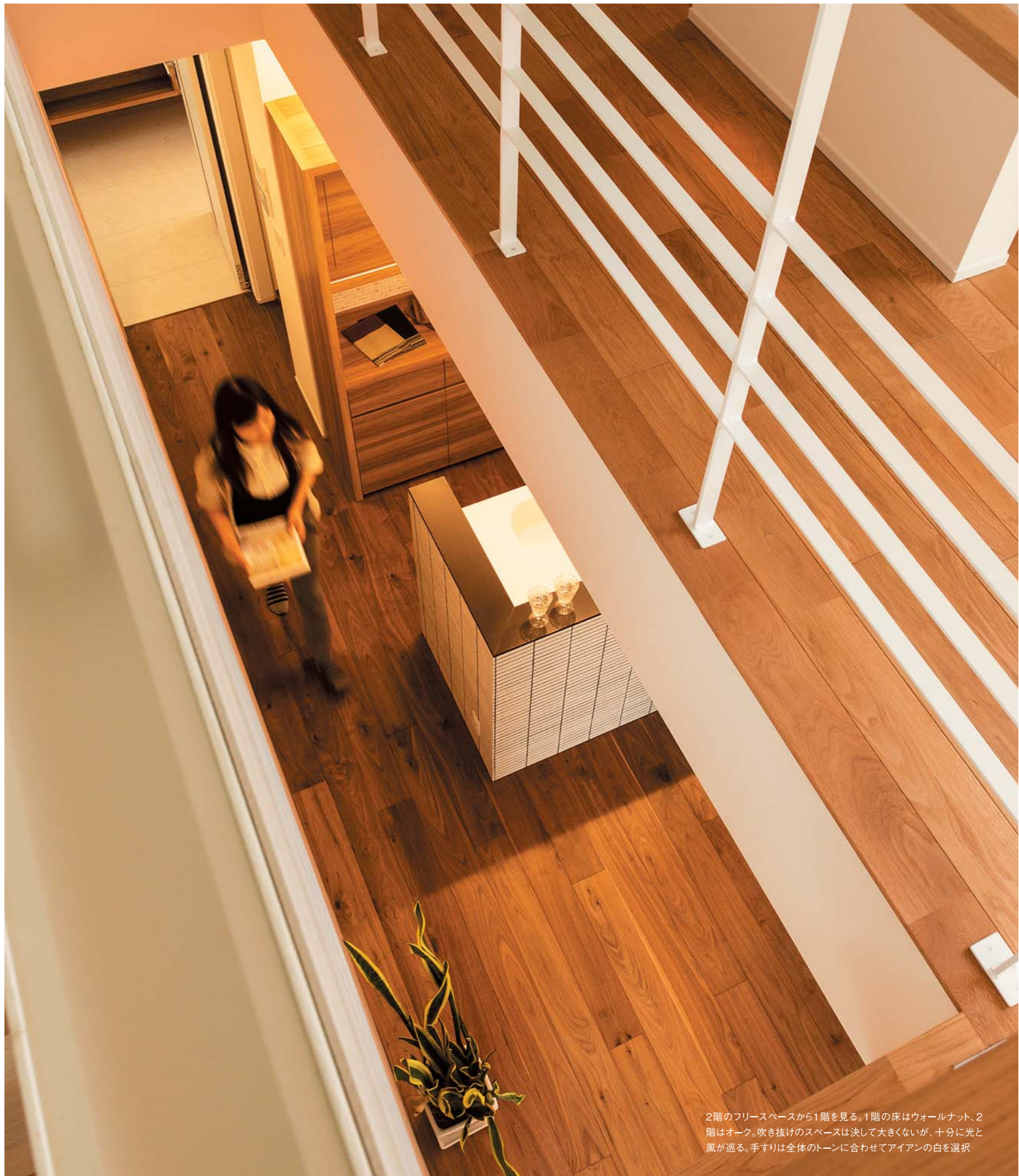
2階のフリースペースから1階を見る。1階の床はウォールナット、2階はオーク。吹き抜けのスペースは決して大きくないが、十分に光と風が巡る。手すりは全体のトーンに合わせてアイアンの白を選択