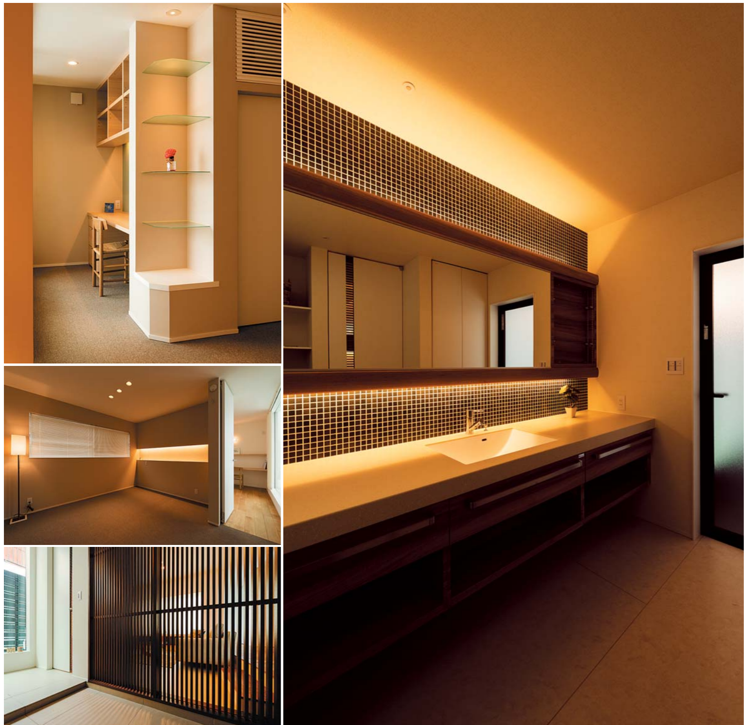
左上／寝室の入り口には飾り棚と書斎コーナーを設置 左中／2階の寝室は、細長い窓や間接照明を採用して落ち着いた雰囲気にまとめた 左下／玄関ホールからリビングを見る。格子の建具を採用し、段差なくフラットにつなげることで空間に広がりをもたせた 右／洗面まわりには落ち着いた色の小さなモザイクを採用してラグジュアリーな雰囲気に。たっぷり収納できる洗面台や大きな鏡を付けた棚はオリジナルで製作