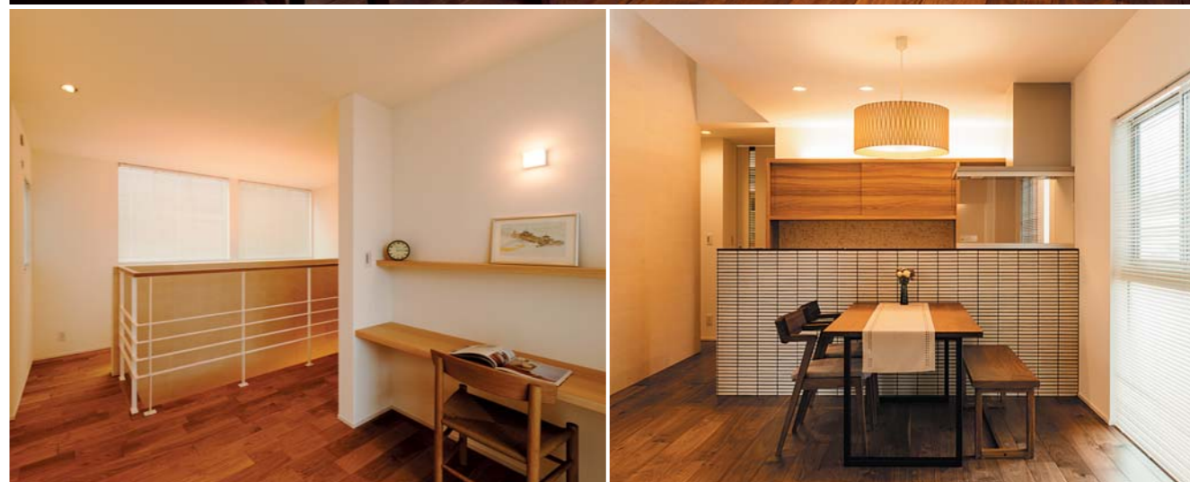
上／キッチンからリビングスペースを見る。段差を設け、床材を変えることで見えない仕切りとしている。TVボードなどの造作家具は、サペリという木材を使用 下左／2階バルコニーまわりのフリースペースには多目的に使用できる空間を。左手の壁には、お子さんの絵を飾るためのピクチャーレールを設置 下右／キッチンはル・コルビュジエの頃のような上質感をイメージして、やわらかい雰囲気を残しつつ黒をアクセントに仕上げた